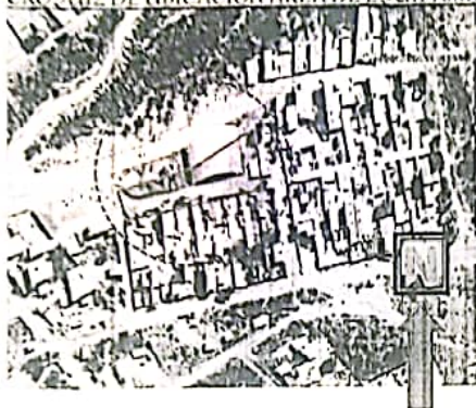
COORDENADAS UTM-WGS 84